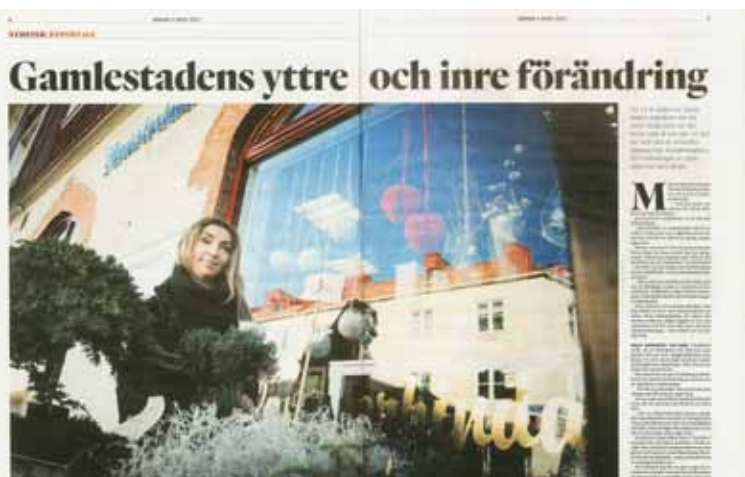
2017 var året då tidningarna skrev om Gamlestadens omvandling. Göteborgs-Posten 20170402

Hisingen, i Lerum och Kungsbacka. 28 band spelade på 19 scener runt om i staden och Regionen för totalt 2300 konsertbesökare. Banden innehöll totalt 135 musiker från Sverige, Norge, Danmark, Finland, England, Skottland, Grekland, Tyskland och Frankrike. Som vanligt fick festivalen en hel del mediautrymme. Festivalen omsatte 474 000 kronor, varav Fastighetsägare i Gamlestad alltså bidrar med 25 000 kr.