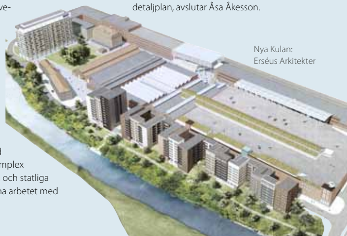
Nya Kulan: Erséus Arkitekter