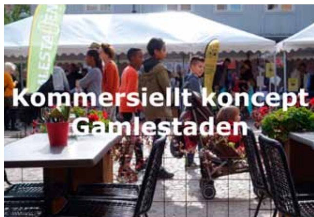
Ett viktigt underlag till det områdesbaserade utvecklingsarbetet är reteams Verksamhetsutredning Gamlestaden från 2016, som finns att ladda ner på helagamlestaden.se .